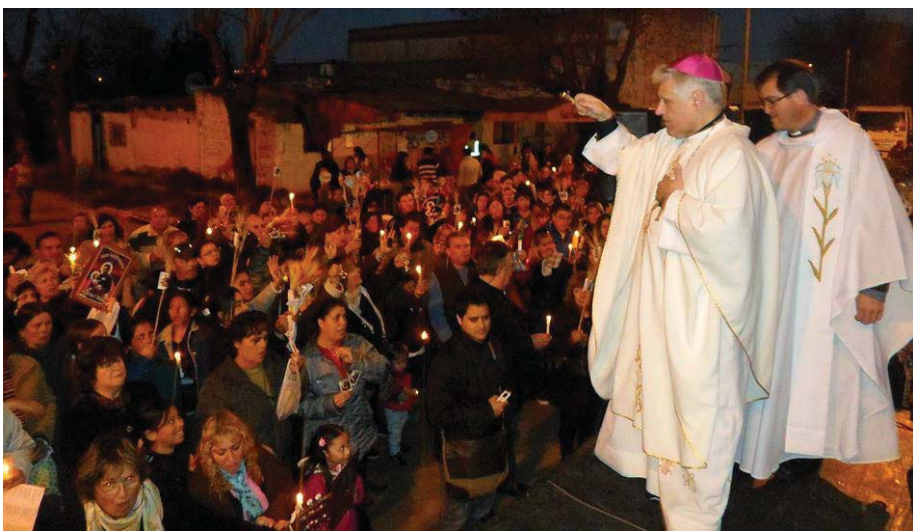
Con profunda unción popular se celebró la Festividad del Patrono del Pan y el Trabajo ...