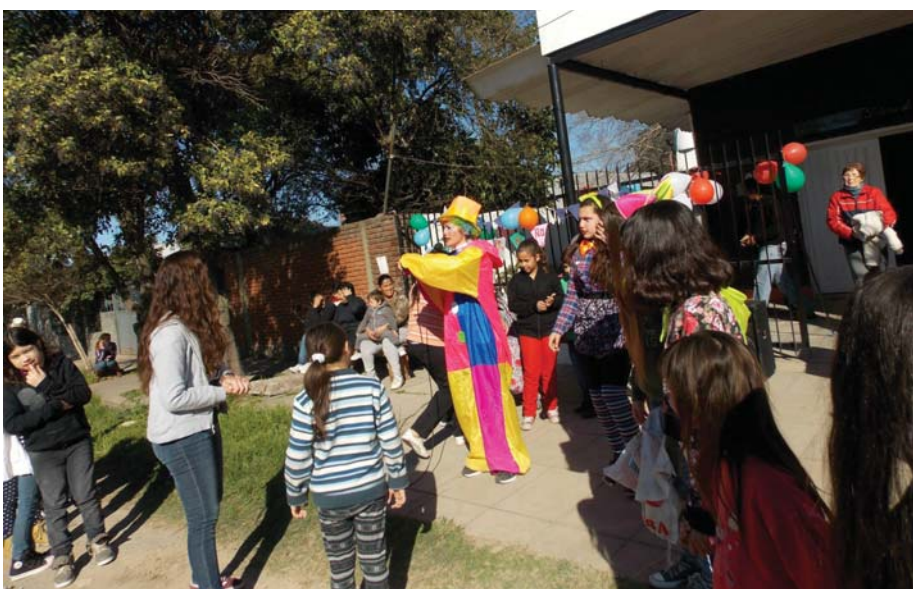
“Dejad que los niños vengan a mí porque de ellos es el reino de los cielos”...